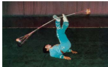
(圖二 中國雜技－水流星)