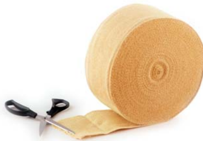
(圖六 一般火舞者使用於燃燒上的防火布)

防火布分為滅火使用的防火布以及使用在燃燒上的火布。燃燒上使用的火布特性是能耐高溫至 800°C，且燃燒次數能達 300 次以上。對於專業舞者也較喜歡使用火布製作成火具。而防火布的特性為不易燃，在高溫下不會熔融或收縮；火舞表演者在滅火時，有時也會碰到意外狀況，急需滅火，相較於一般毛巾，防火布也較適合滅火。