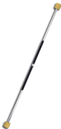
(圖三 使用鋁棍及火布製成的火棍)