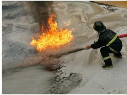
(圖八 燃燒易產生濃煙的煤油)