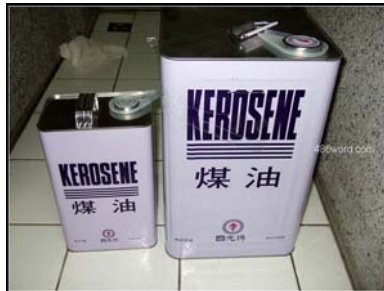
(圖九 火舞者以煤油取代去漬油及無鉛汽油)

煤油的特性為助燃、不易燃，且安全性高，是最適合火舞表演者所使用的油料之一，與前兩項作比較，去漬油需謹慎使用，則無鉛汽油較不適合火舞表演者使用，煤油算是裡面之中最安全的一個。