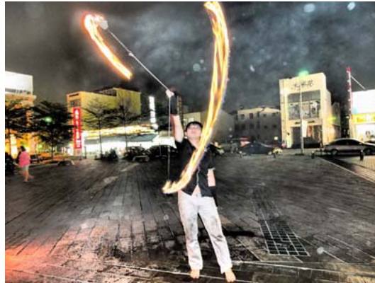
(圖五 火舞者使用火流星進行表演)

因許多場地不適合「火」的表演，又希望演出中能有光源的效果，所以許多團體發展出較接受度較高、且安全的道具；例如：在道具原本應燃燒的地方加裝 LED 燈、螢光棒甚至運用高科技的雷射光，使表演效果不亞於火的表演道具。