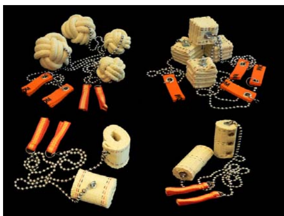
(圖四 各種不同樣式的火鏈)

火鏈的形式多變，早期許多人會以兩條童軍繩末端綁重物來練習。後期甚至發揮創意使用長襪內放置有重量的物體，例如：網球、壘球等重物來練習火鏈；至今有許多人會以三十公分長的鐵鍊、釣魚用的培林轉環、火布來組成。許多表演者為了求新求變也將火鏈道具改變，像是使燃燒面積擴大像是鞭子一樣，呈現整條火鏈都燃燒，而這樣的道具稱為「火鞭」。