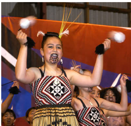
(圖一 毛利婦女 Poi 慶典表演)

另外在中國傳統雜技中又有一個稱為「流星」的傳統技藝，分為水流星及火流星，是在一條彩繩兩端各接一個裝滿水的玻璃碗或接著內有燃燒木炭的鐵絲網，在平面內做圓周運動，與火鏈類似，就是現在我們所稱的「火球」或「炭球」。而火舞的流傳，乃拜現今工業發展交通便利所賜，觀光業的發展、間接促成了火舞在世界各地的流傳。