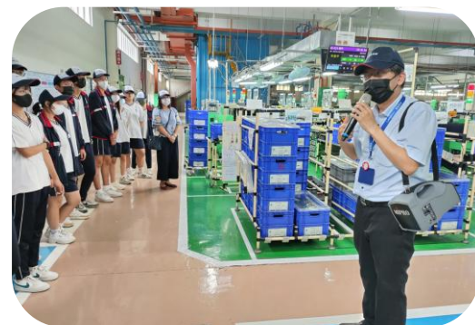
務實致用-企業實習 參訪十年達150場