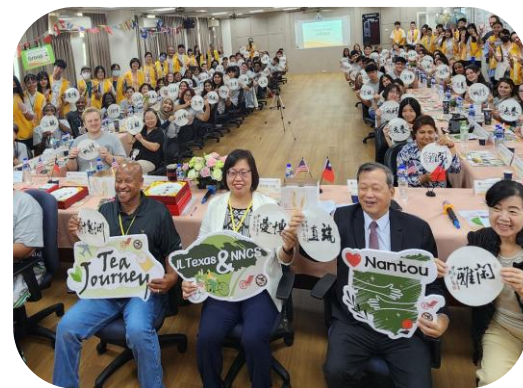
國際教育-接待 外籍生達250名