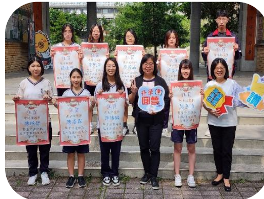
升學榮耀-國立科大 會考填志願 達30%