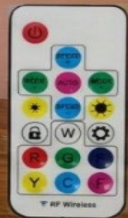
遙控器與APP雙重控制