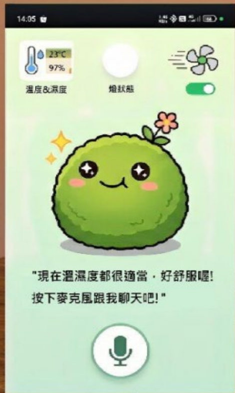
APP : AI擬人化對話