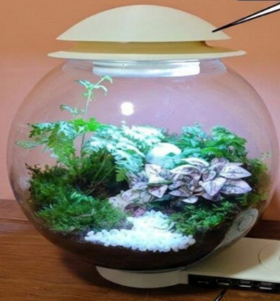
底座中間 : USB充電孔