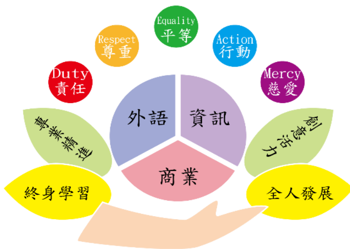
圖 1 本校學校願景及學生圖像

本校課程發展核心工作小組依據本校願景目標及《十二年國民基本教育課程綱要》，規劃本校 108 新課綱課程與學校優質化的方向與實施策略，作為課程發展滾動修正的基礎，以期落實新課綱核心素養的精神和技術型高中務實致用的目標。